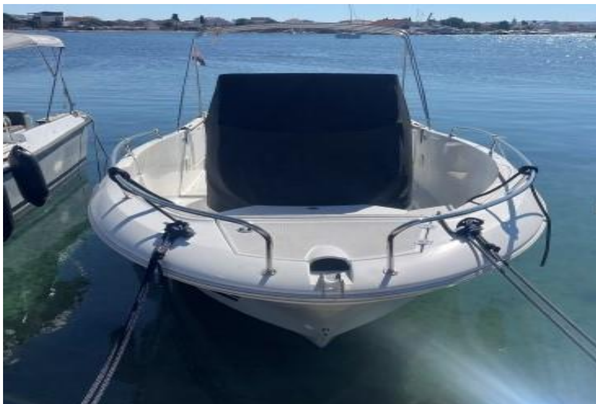
Slika 2 : Jeanneau Cap Camarat 7.5 cc – 289961 VD