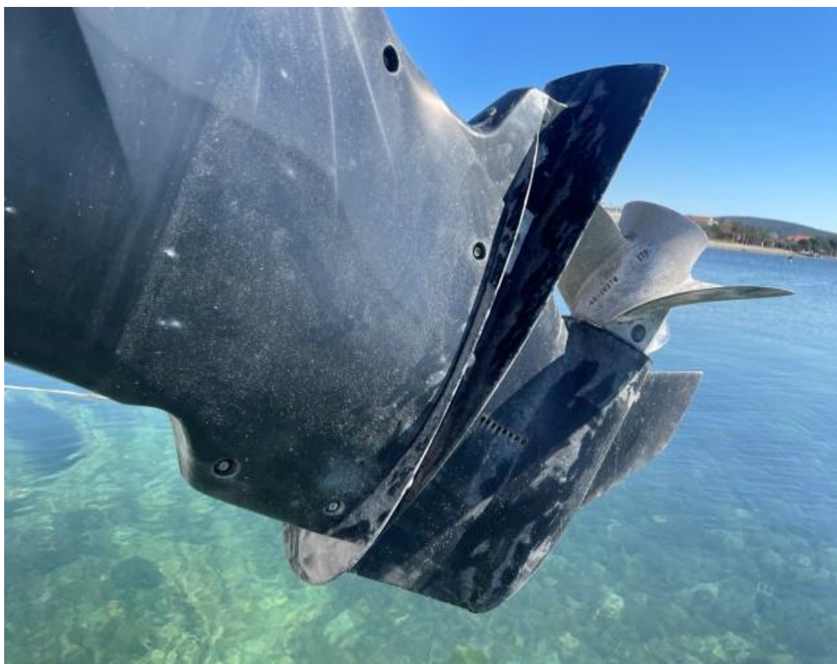
Slika 10 : Jeanneau Cap Camarat 7.5 cc – 289961 VD – pogonski mjenjač i pogonski propeler