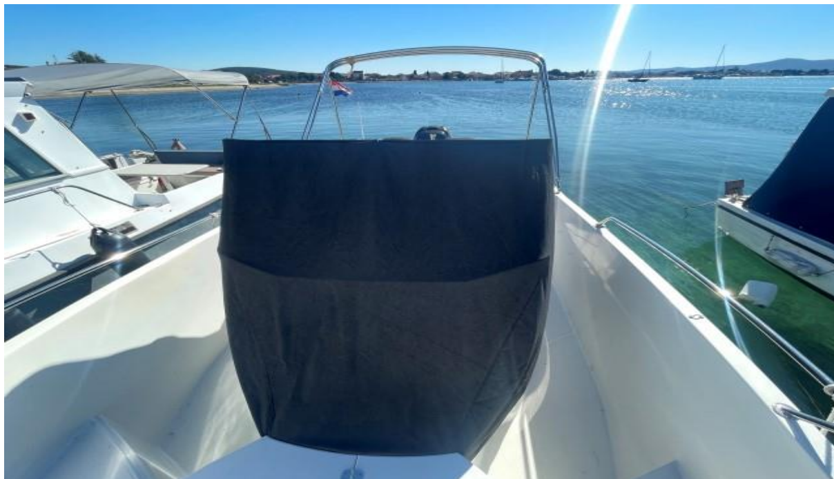
Slika 3 : Jeanneau Cap Camarat 7.5 cc – 289961 VD

Pregled plovila je obavljen dok je brodica bila u moru te podvodni dio trupa nije pregledan. Oprema i uređaji nisu isprobani u radu (vidi slike od 3 do 11).