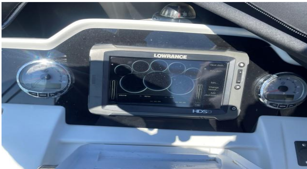
Slika 9 : Jeanneau Cap Camarat 7.5 cc – 289961 VD – gps