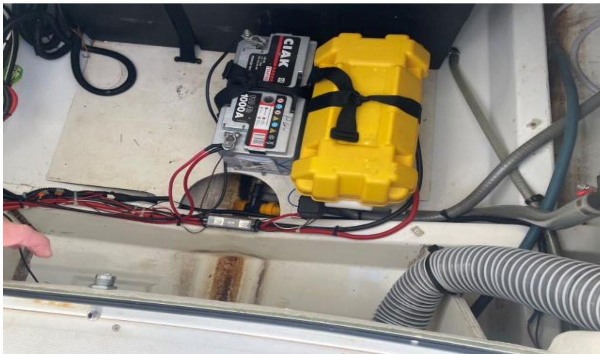
Slika 7 : Jeanneau Cap Camarat 7.5 cc – 289961 VD – kaljužni prostor i baterije