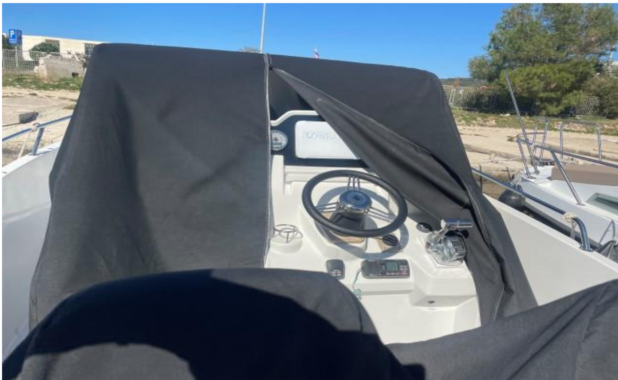
Slika 11 : Jeanneau Cap Camarat 7.5 cc – 289961 VD – centralna upravljača konzola