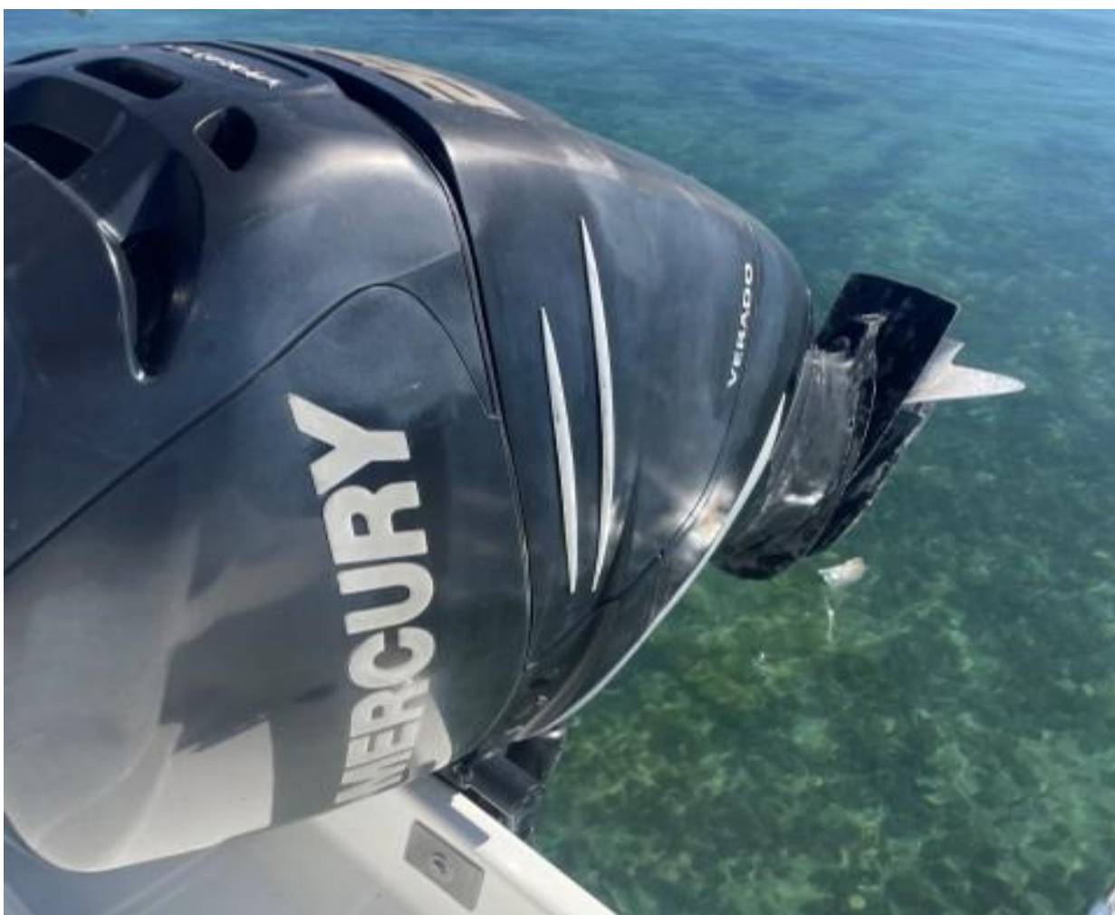
Slika 6 : Jeanneau Cap Camarat 7.5 cc – 289961 VD – pogonski motor