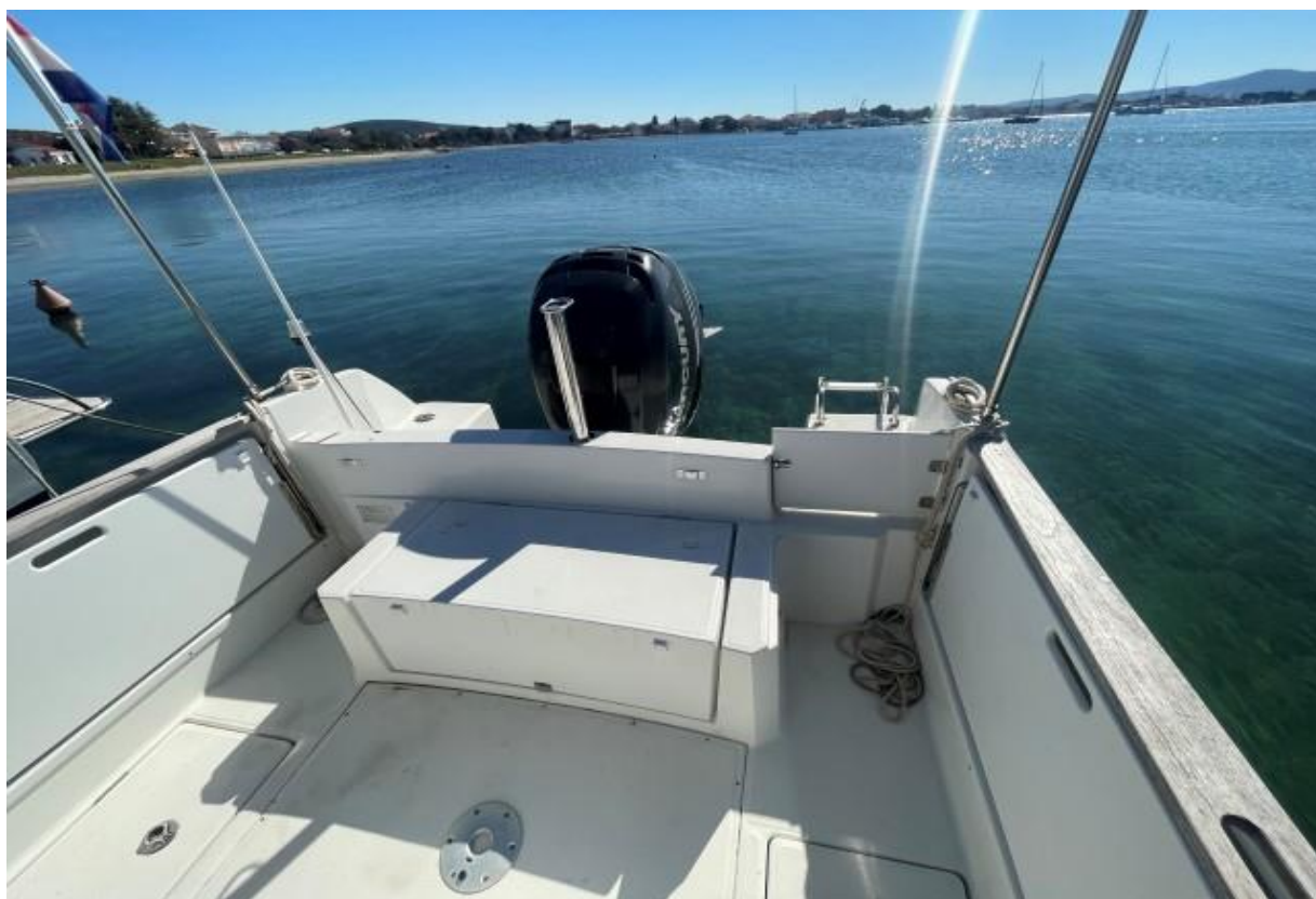
Slika 4 : Jeanneau Cap Camarat 7.5 cc – 289961 VD