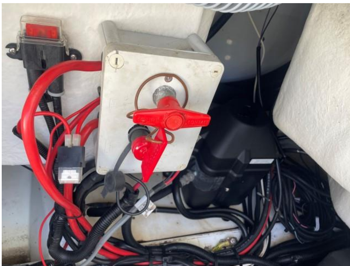
Slika 8 : Jeanneau Cap Camarat 7.5 cc – 289961 VD – elektro sustav