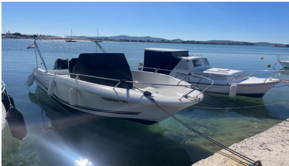
Slika 1 : Jeanneau Cap Camarat 7.5 cc – 289961 VD

Pregled plovila obavljen u Sukošanu 04.03.2025. dok je plovilo bilo na svom vezu u moru (vidi slike 1 i 2).